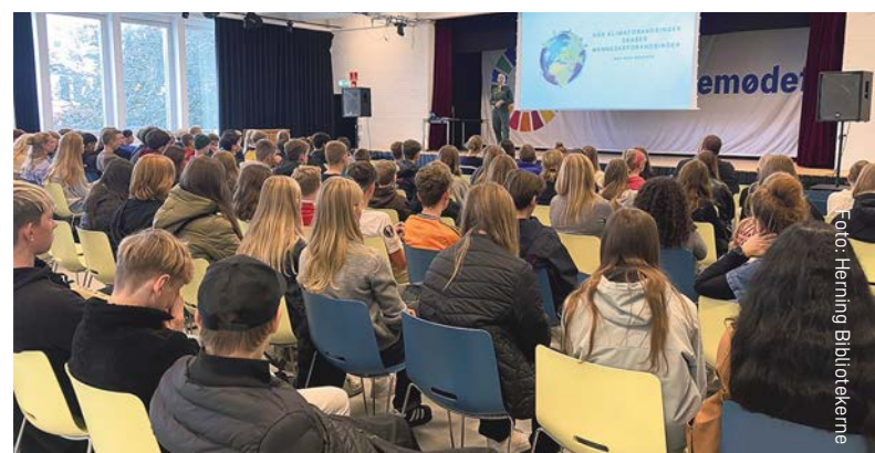
Børnefolkemøde 2024 om klima i Herning.